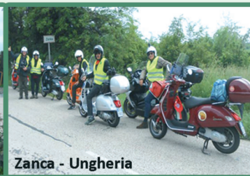
Zanka - Ungheria