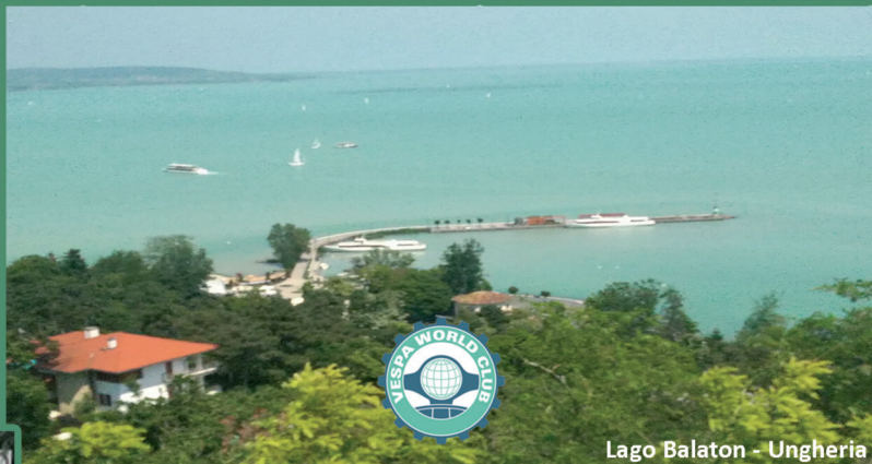
Lago Balaton - Ungheria