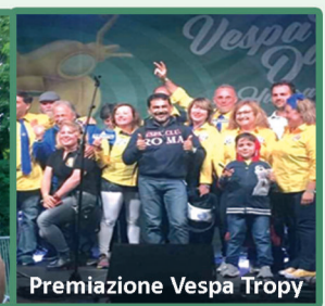
Premiazione Vespa Tropy

Possiamo dire che il nostro sodalizio è uno dei Vespa Club piu' attivi e vanta un vessillo bellissimo che, il Vespista romano con grande orgoglio, posiziona proprio sullo scudo anteriore della propria Vespa in occasione di manifestazioni a cui intende partecipare, la mitica "Fascia Scudo Rossa con i loghi istituzionali e la scritta gialla".