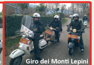
Giro dei Monti Lepini